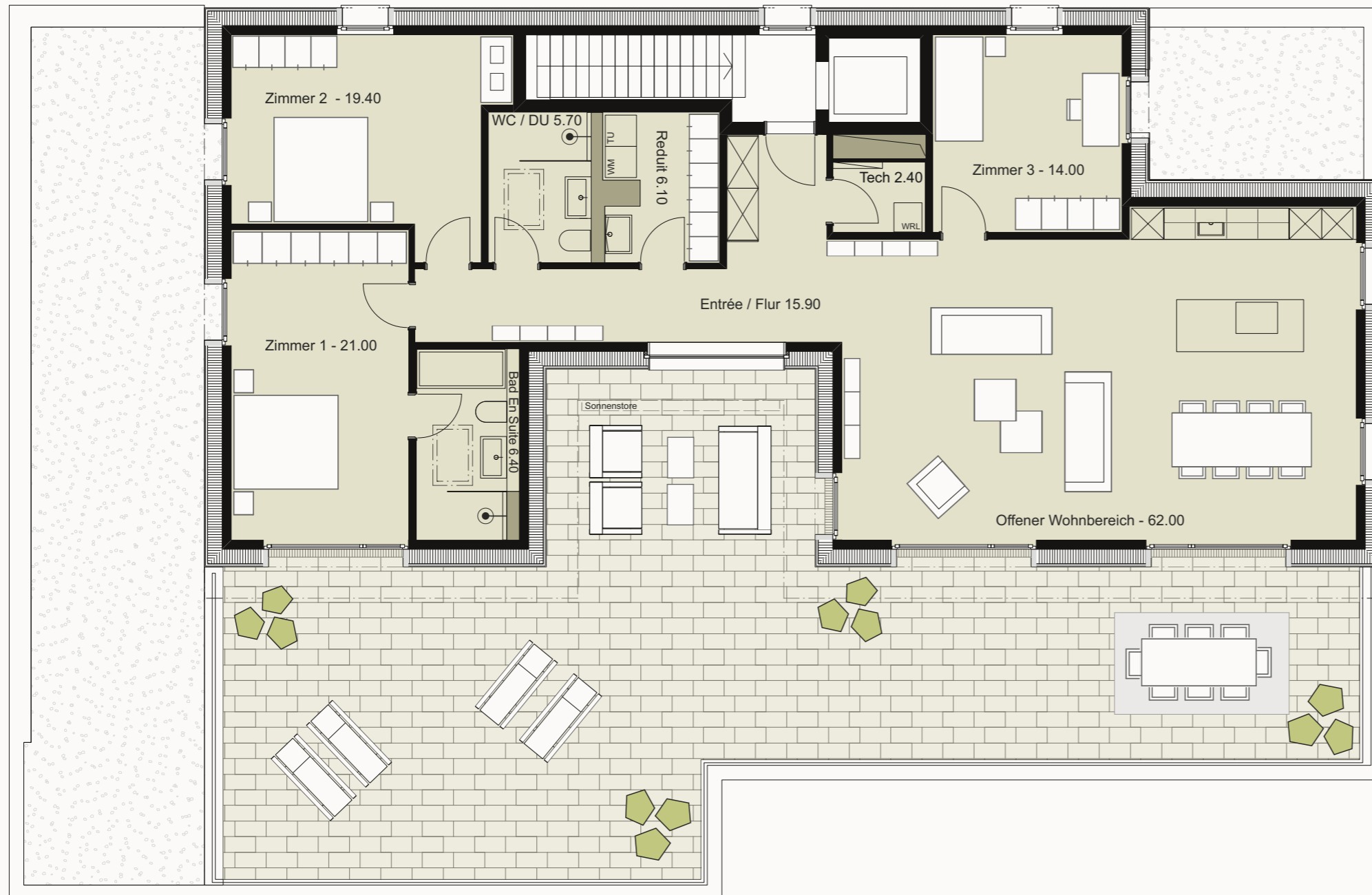
Südwest Terrasse mit geschütztem Atrium 124.50m2